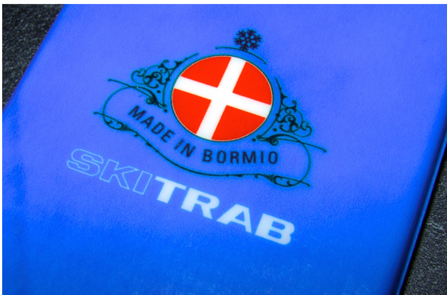
SKI TRAB, Made in Bormio (Italia) depuis 1946.

Car nous pouvons le dire, SKITRAB c'est tout simplement la Rolls&Royce du ski de rando : il n'y a pas de meilleure qualité de fabrication sur le marché à l'heure actuelle. S'il ne fallait qu'une seule preuve : la garantie de 3 ans apportée sur leurs skis. Et aucun SAV en 10 années chez Montania !