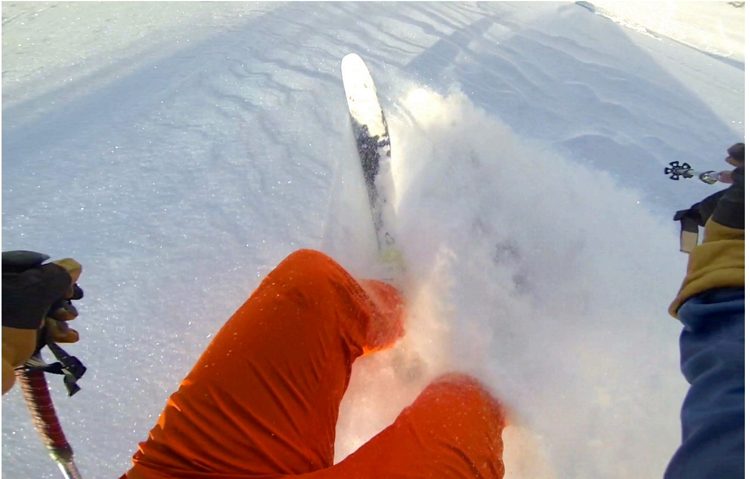
Vue depuis la caméra GoPro de Loïc.