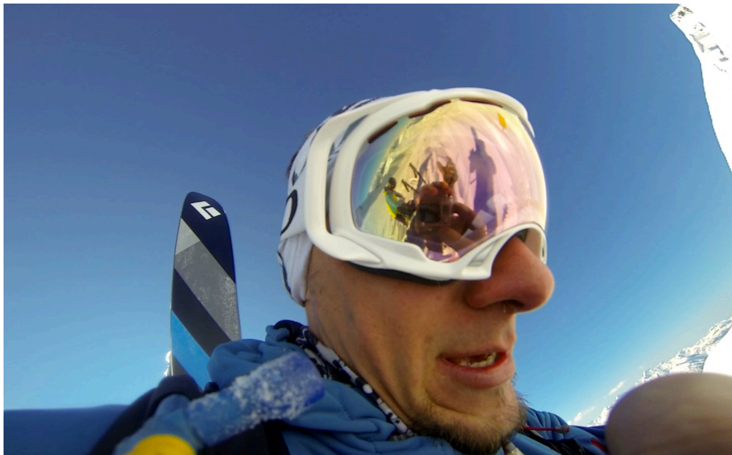
Selfie à la GoPro !