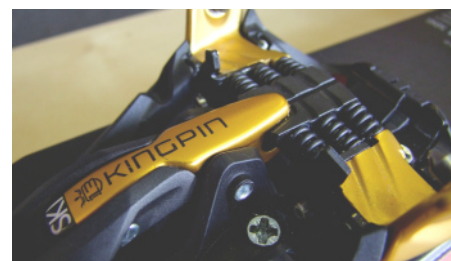
Fixation MARKER Kingpin : notre vidéo en exclusivité Dans "Comparatifs et Test Matos"

BLACK DIAMOND FREERIDE LOÏC LEHELLE SKI DE RANDONNÉE