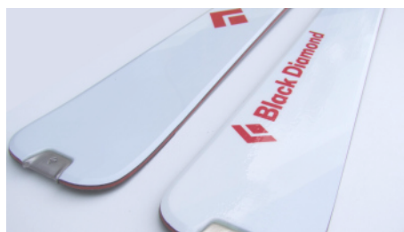
Nouveaux skis de rando Black Diamond en carbone Dans "Showroom"