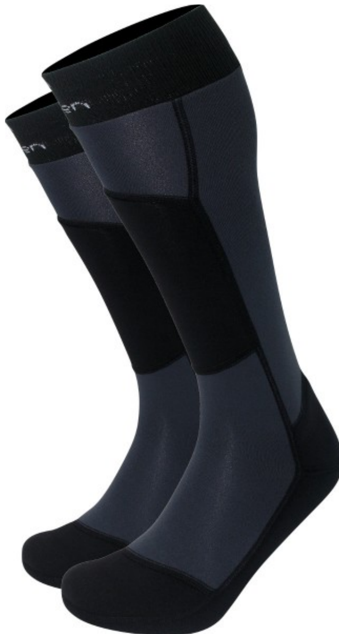
Les chaussettes LORPEN Polartec Trekking Expedition (TEPA)