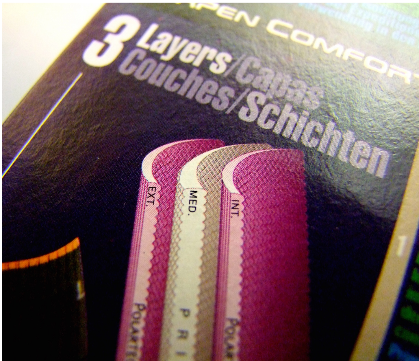
Le système 3 couches : Polartec + Primaloft + Polartec

Une couche Primaloft entourée par deux couches Polartec :