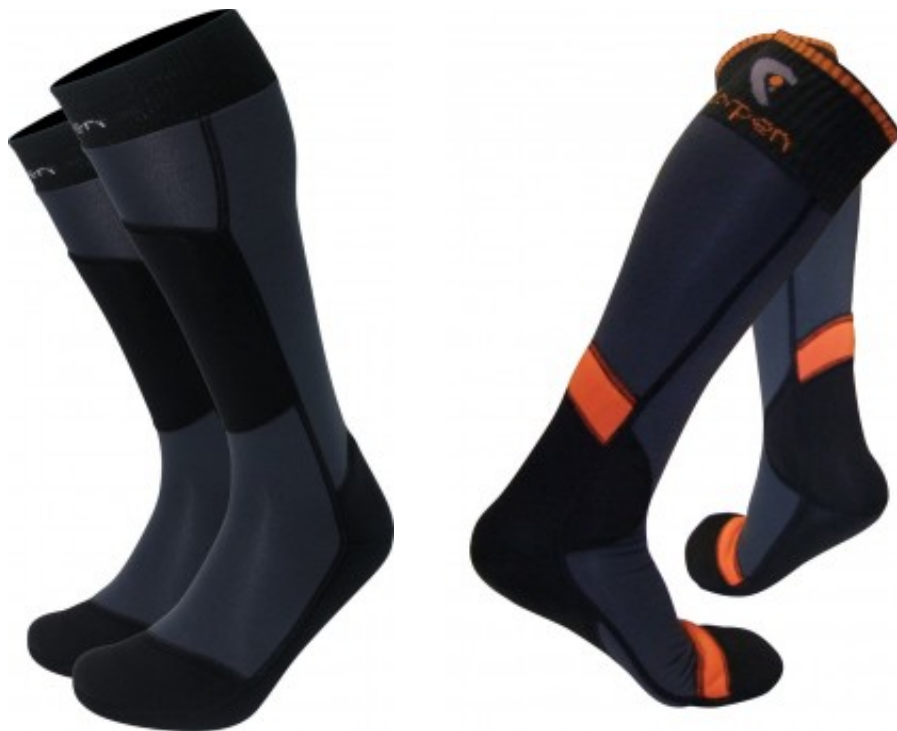
Les chaussettes LORPEN Polartec Trekking Expedition (TEPA)