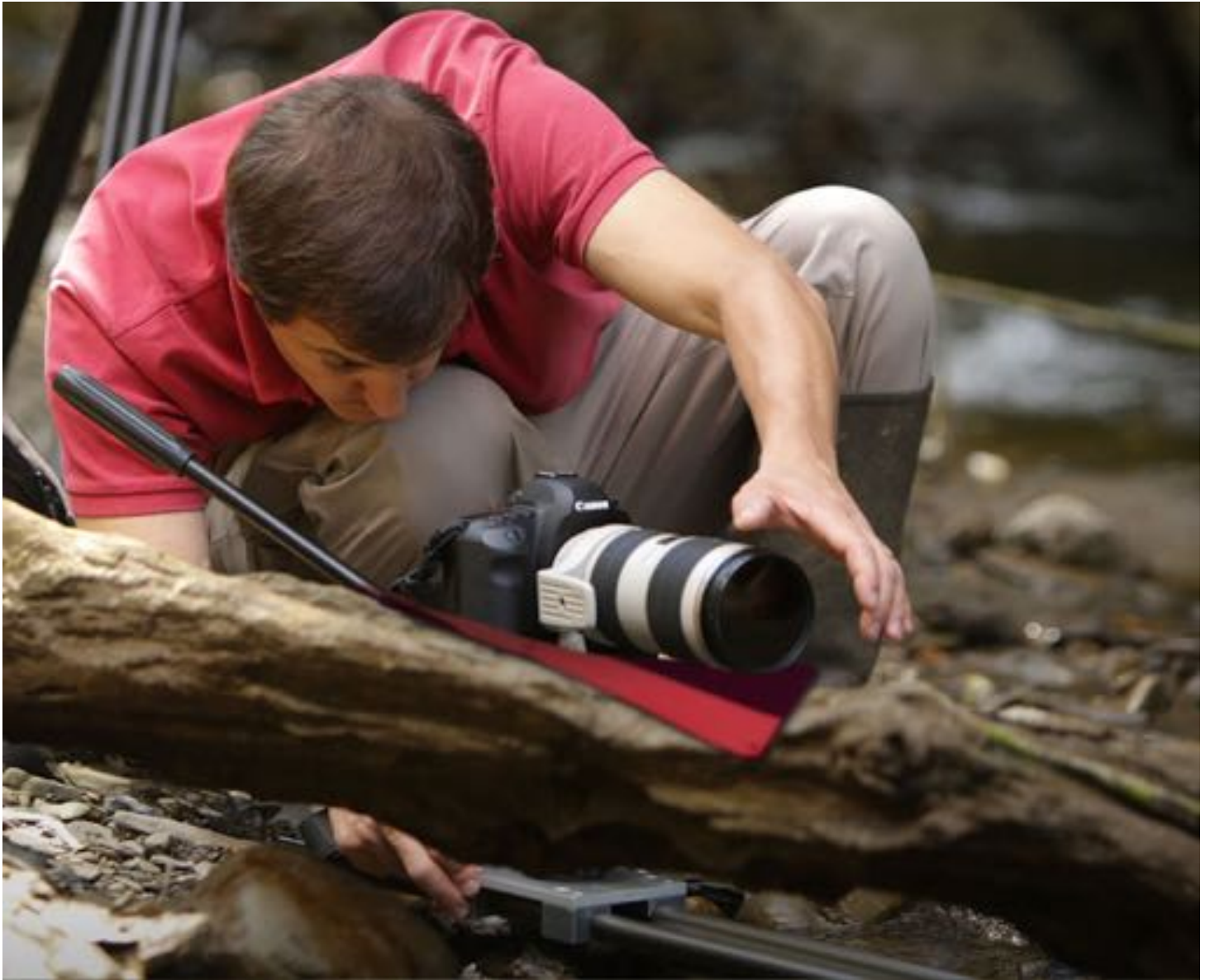
Pour de la photo...