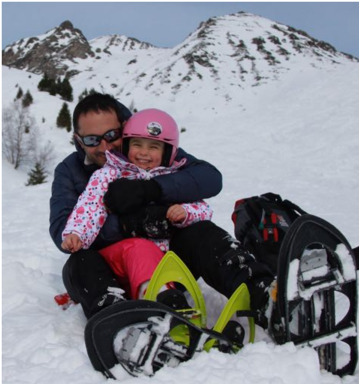
Isole du froid.